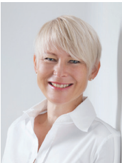
Doris Brand Projektbüro Joint Medical Master in St.Gallen